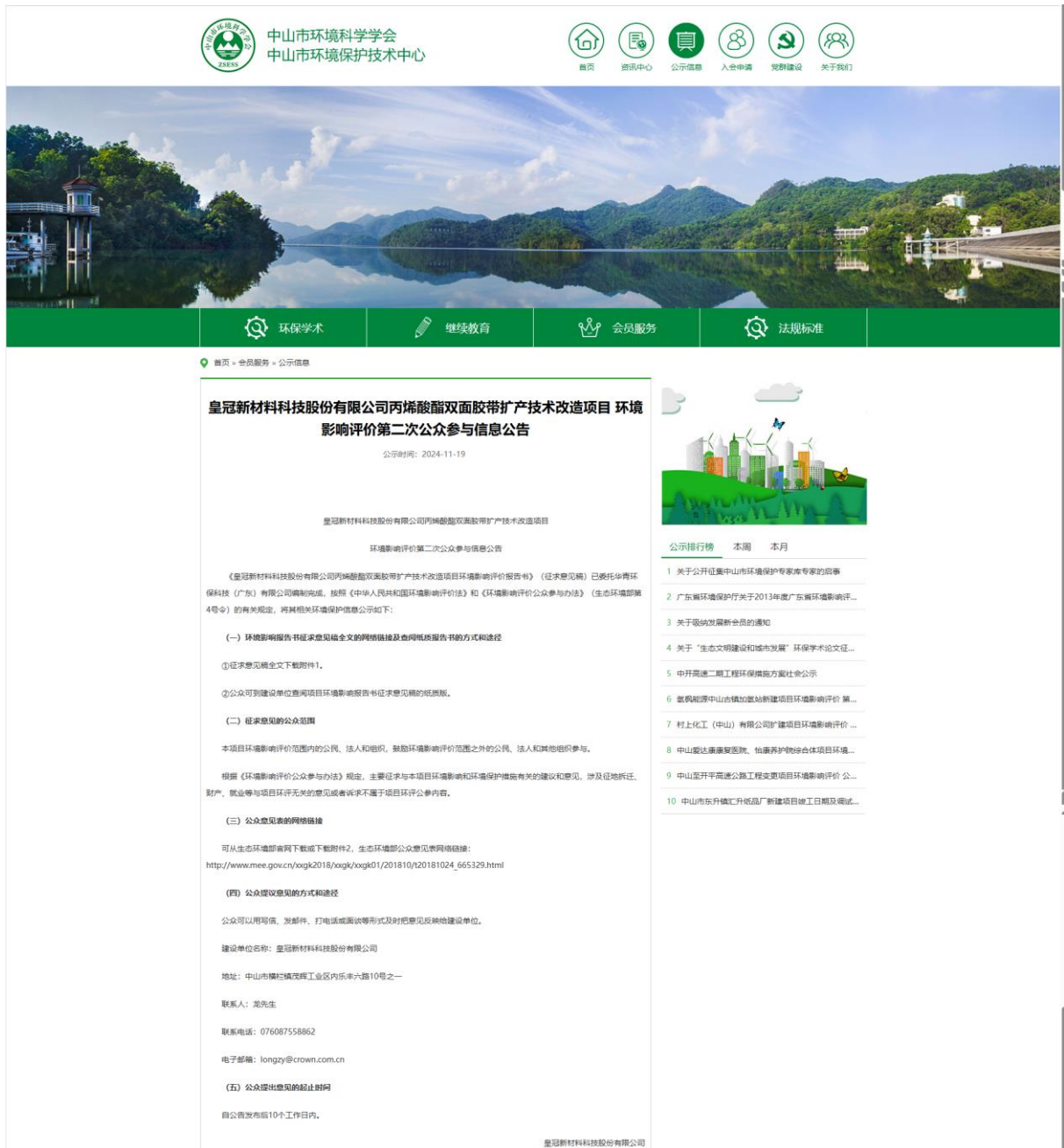
图3.4-1 征求意见稿网上公示截图