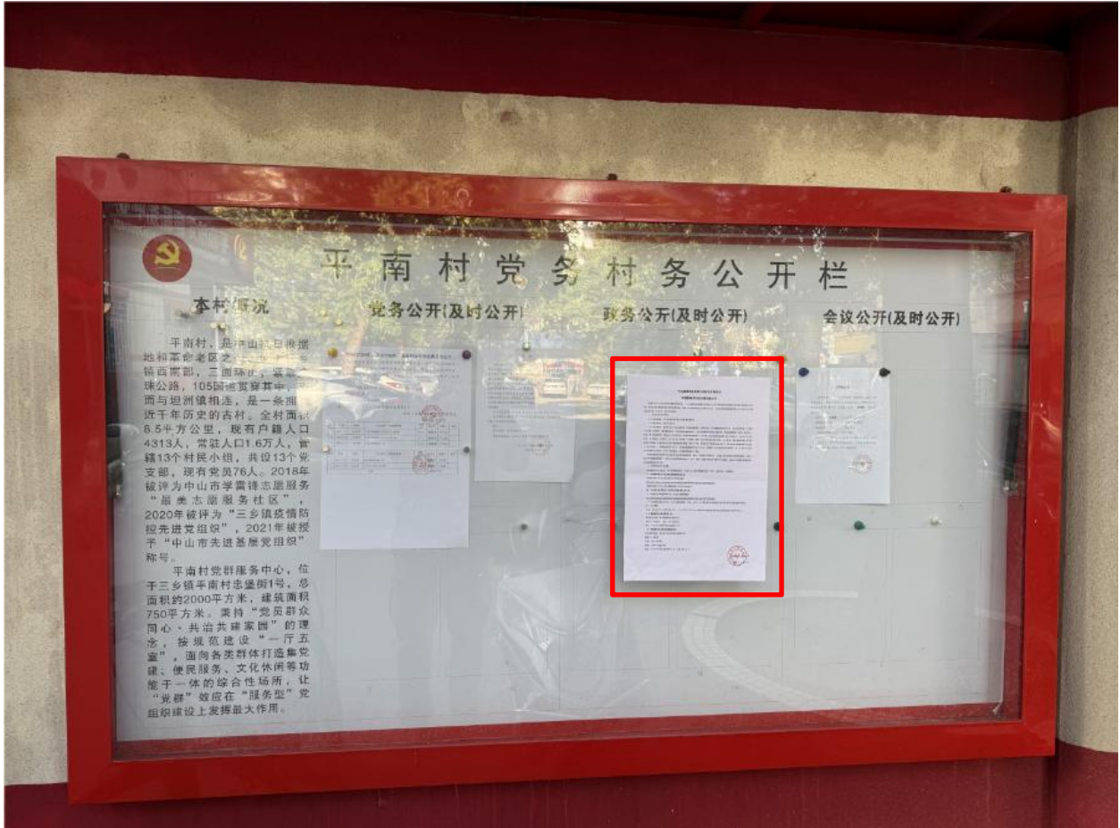
图 3-4 (1) 平南村村委会征求意见稿公示现场图片