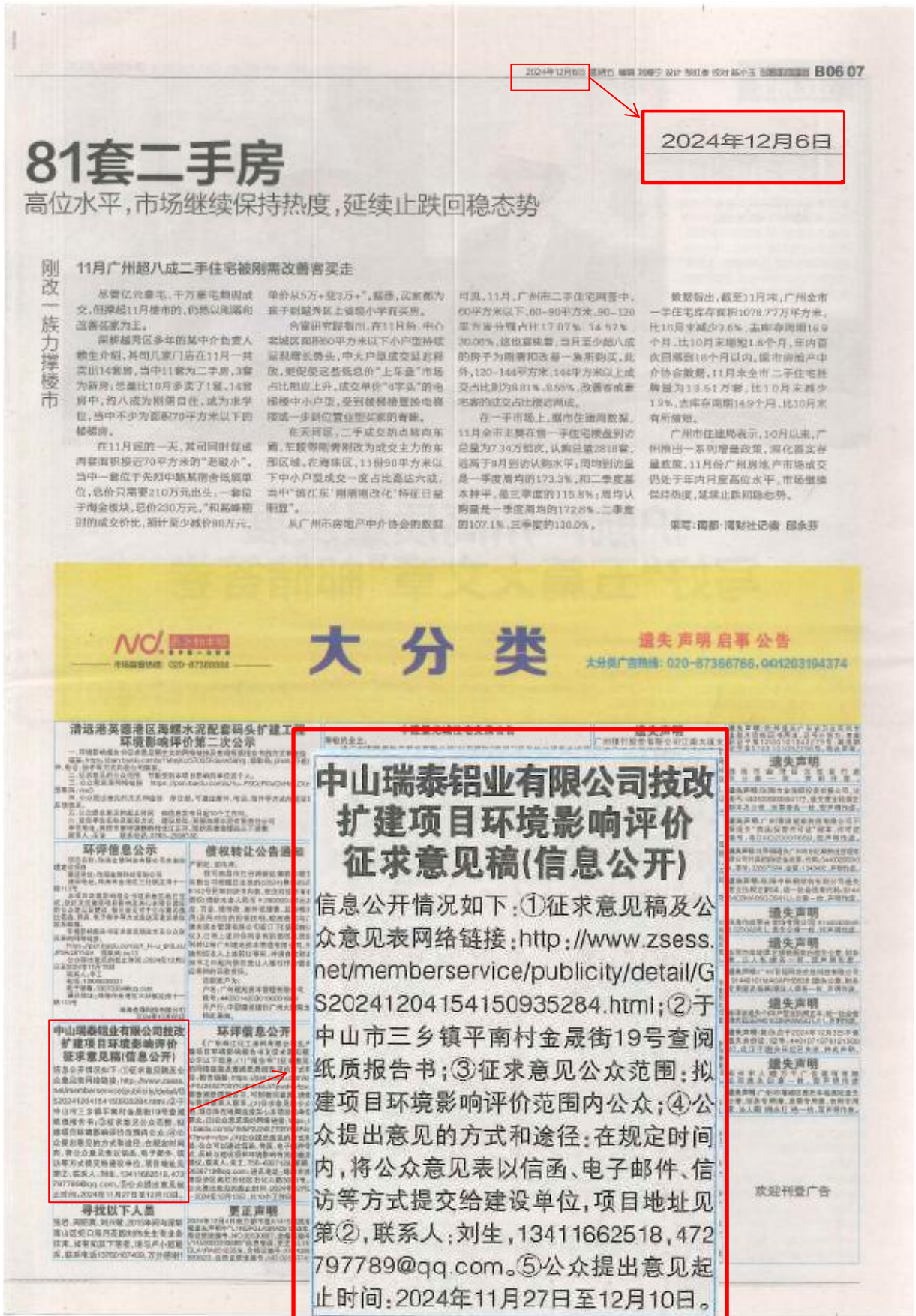
图 3-2 (1) 征求意见稿公示报纸公示照片