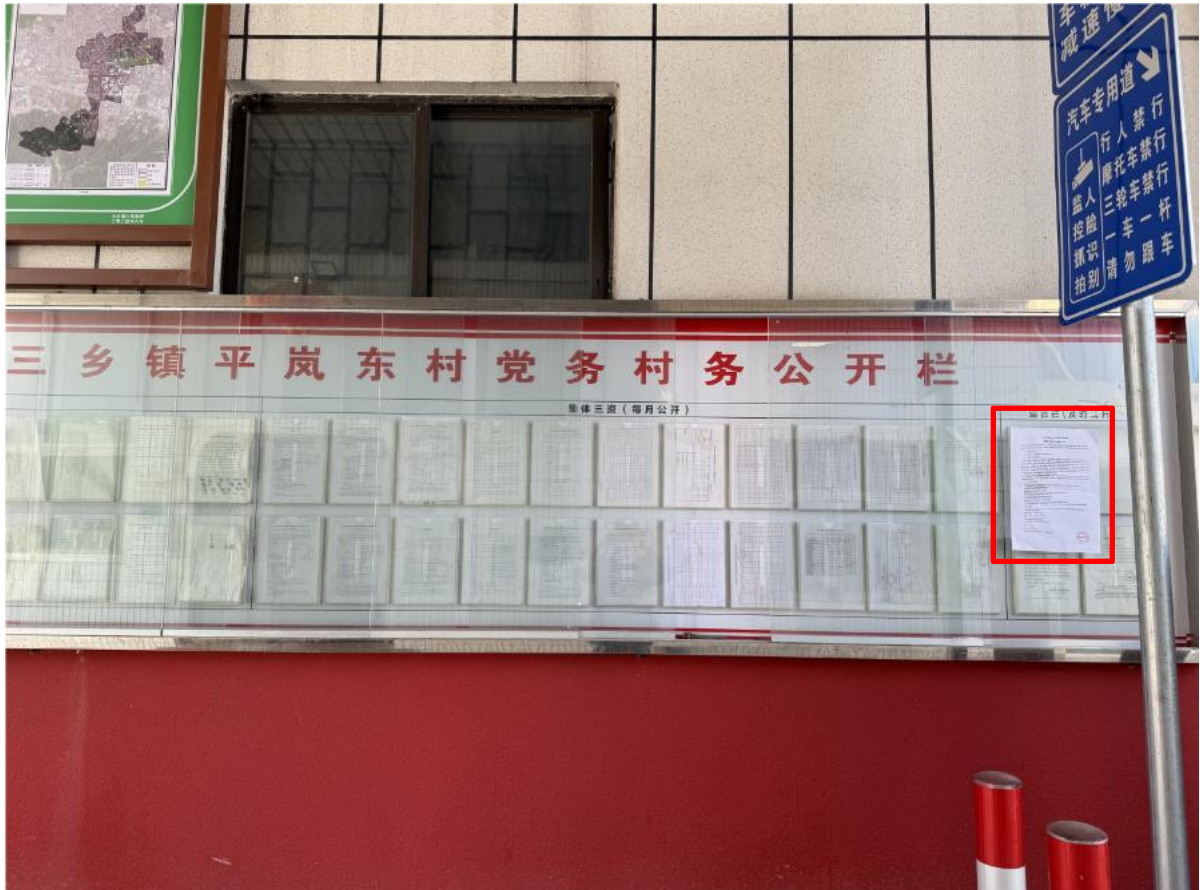
图 3-5（1）平岚东村村委会征求意见稿公示现场图片