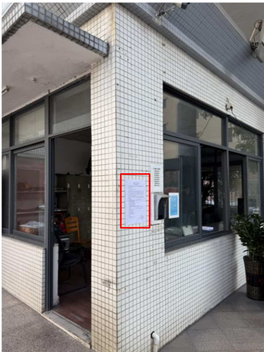
图 3-3（1） 厂区大门处征求意见稿公示现场图片

张贴区域选取的符合性分析： 本项目征求意见稿公示选取本项目周边敏感点平南村、平岚东村等地方作为张贴区域，分别于平南村村委会、平岚东村村委会宣传栏这些公众易于知悉的场所张贴公告，并持续公开时间不少于 10 个工作日，符合《环境影响评价公众参与办法》的要求。