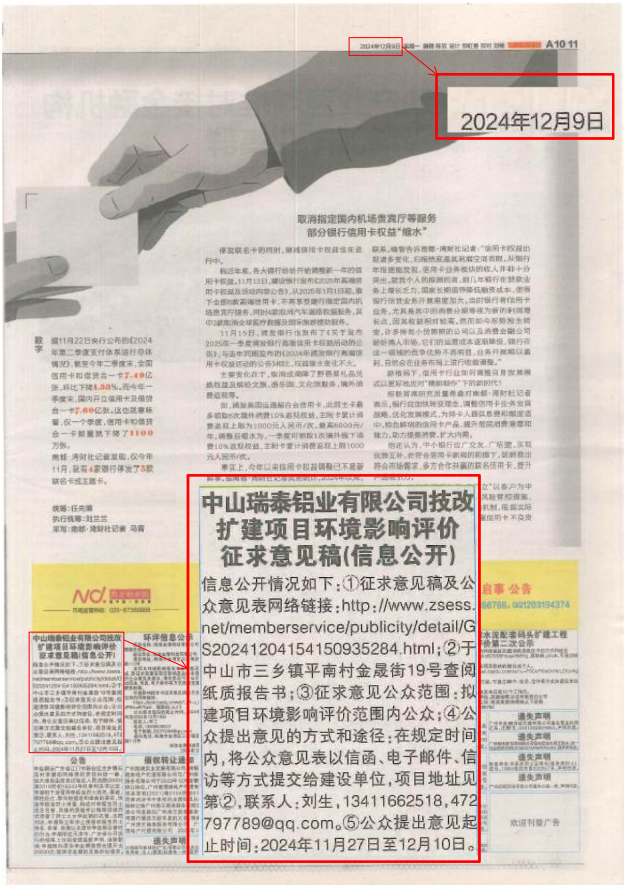
图 3-2 (2) 征求意见稿公示报纸公示照片