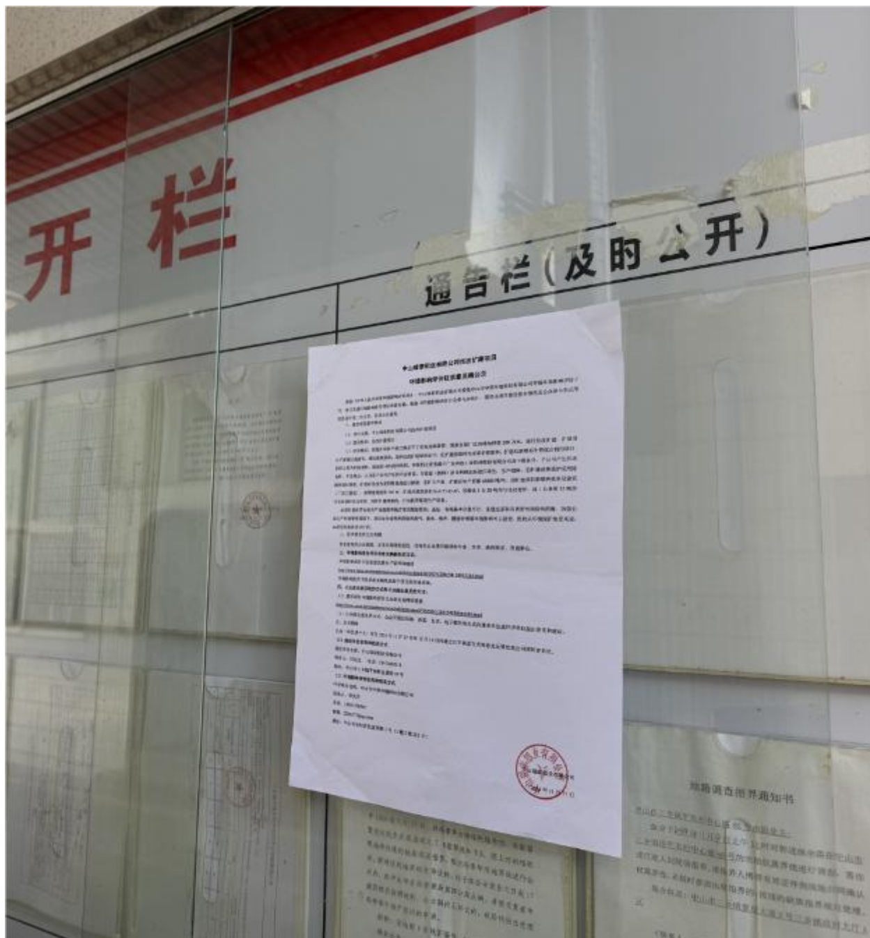
图 3-5 (2) 平岚东村委会征求意见稿公示现场图片