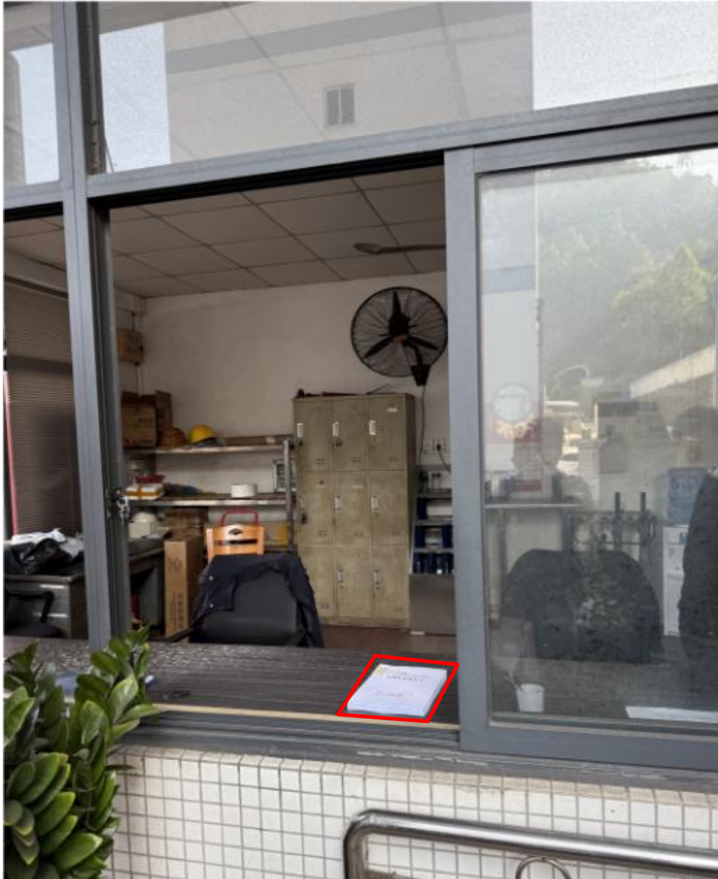
图 3-6 环评报告书征求意见稿查阅场所设置现场图片